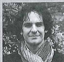
Stéphane AYRAULT Co-Secrétaire National de L'ALLIANCE