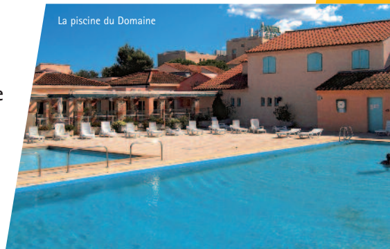
La piscine du Domaine