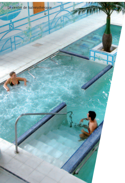
Le centre de balnéothérapie