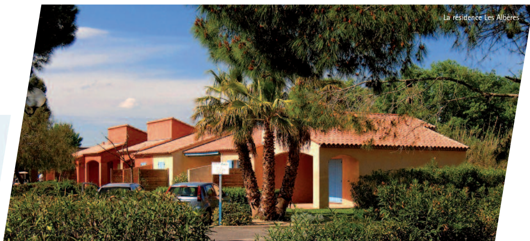
La résidence Les Albères