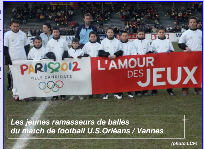
Les jeunes ramasseurs de balles du match de football U.S.Orléans / Vannes

Toutefois, les ligues peuvent encore s'adresser au CROS pour réserver les banderoles « Paris 2012 » disponibles en prêt.