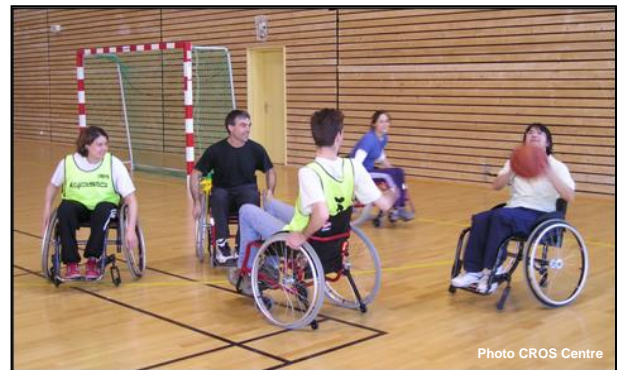
Les stagiaires mis en situation de handicaps pour pratiquer ici, le basket

Les 22 et 23 mars dernier s'est déroulée au CREPS de la Région, à Bourges, la première session de formation « Sport et Handicaps » proposées par le CROS et la DRDJS.