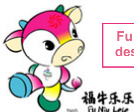
Fu Niu Lele, la mascotte des Jeux Paralympiques