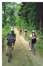
VTT en forêt