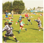
Le Rugby des 5-7 ans

>> Nouvelles entités avec lesquelles il est en étroite relation.