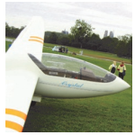
Vol à voile

Liges et Comités Régionaux de la région Centre