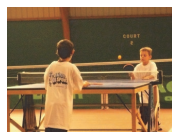
Tennis de table.

Liges et Comités Régionaux de la région Centre