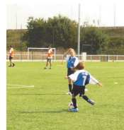
Le football féminin