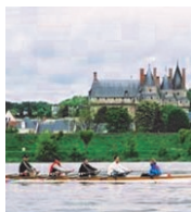
Randonnée à l'aviron

>> de contribuer et de participer à la défense de la pratique sportive et du patrimoine sportif en région Centre, >> de représenter le sport pour toutes les questions d'intérêt général, notamment auprès des pouvoirs publics et des organismes officiels régionaux, >> de sauvegarder et de développer l'esprit olympiques suivant les principes définis par le CNOSF dont il est le représentant au niveau régional, >> d'organiser et de favoriser la formation initiale et continue des dirigeants, officiels, techniciens et plus généralement des membres des organismes sportifs de la région. >> de participer à la lutte contre l'exclusion et de favoriser la cohésion sociale.