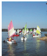
Fête du nautisme.

Constitué sous forme associative, le Comité Régional Olympique et Sportif est à la fois une instance déconcentrée et une structure décentralisée.