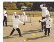
Escrime en plein air

Liges et Comités Régionaux de la région Centre