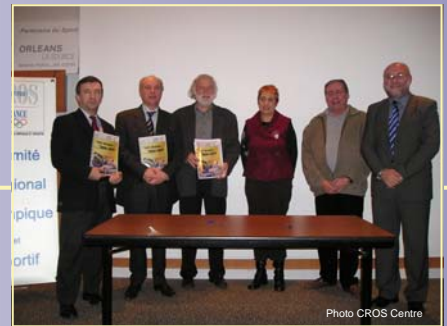
La remise officielle du Manifeste