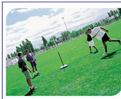
Jeu de Speedball à quatre

La FFEPMM possède d'ailleurs trois centres d'accueil du public et de stages divers de pleine nature, à Sainte-Enimie (Gorges du Tarn), à Bures (Meurthe-et-Moselle) et à Ramberchamp (Vosges).