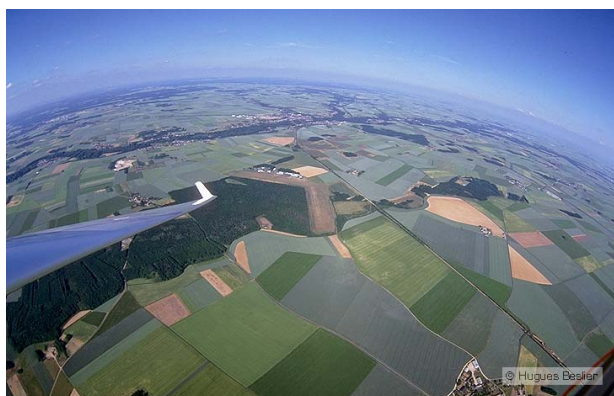
La Beauce en planeur

Les années à venir seront marquées par ces questionnements. Demeureront des objectifs de recrutement auprès des jeunes en partenariat avec les établissements scolaires, et des moins jeunes avec les comités d'entreprises ou d'autres groupements. La réflexion se poursuit au sein du Comité Régional de Vol à Voile, avec le concours du mouvement sportif et l'aide des partenaires institutionnels pour surmonter les embûches actuelles.