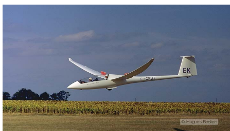
A l'atterrissage

Le planeur est un aéronef sans moteur aux qualités exceptionnelles : le pilote utilise les mouvements verticaux de l'atmosphère pour gagner de la hauteur qu'il transforme en distance parcourue.